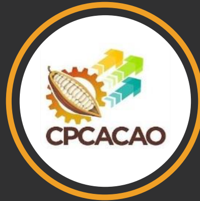
COOPERATIVA AGROINDUSTRIAL CPCACAO TOCACHE LTDA.