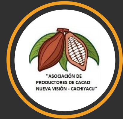
ASOCIACIÓN DE PRODUCTORES DE CACAO NUEVA VISIÓN CACHIYACU POLVORA