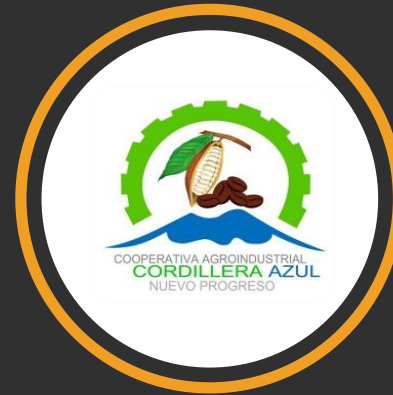
COOPERATIVA AGROINDUSTRIAL CORDILLERA AZUL DE NUEVO PROGRESO LTDA.